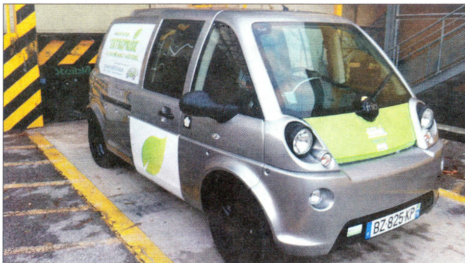
Originale, la Mia électrique est à l'aise dans les trajets urbains.

Avec son regard étonné et des roues riquiqui, la Mia électrique semble née de l'union entre un fourgon blindé et une voiturette sans permis. Cette auto cubique pas beaucoup plus grande qu'une Smart (2,87 m contre 2,70 m) est sortie des cartons à l'issue du long feuillet social de la reprise d'Heuliez. Produite à Cerizay, dans les Deux-Sèvres, depuis juin 2011, cette drôle de petite voiture écolo recyclable à 95 % mise sur la simplicité et l'économie d'utilisation. L'habitacle dépouillé à la finition basique est conforme à ce cahier des charges. On y pénètre en appuyant sur un bouton qui commande l'ouverture des deux portières coulissantes. Surprise : cette ultra-compacte se révèle très habitable. Offrant trois ou quatre places selon les versions, la Mia réserve une place de choix à son conducteur, planté tout seul en position centrale. Si l'effet est assez déroutant au départ et nécessite d'acquiescer de nouveaux repères, on apprécie